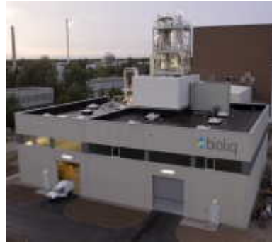
Die bioliq®-Pilotanlage am Forschungszentrum Karlsruhe ( Bild in Druckqualität zum Download )